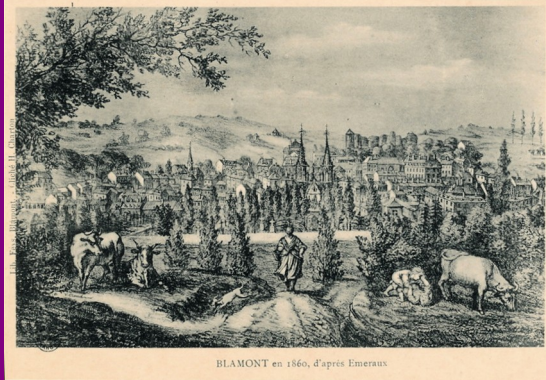
BLAMONT en 1860, d'après Emeraux

Le catalogue de la Bibliothèque nationale - Département des Estampes , mentionne trois lithographies de Justin Emeraux, dont deux représentent Blâmont. Celle ci-dessous, 1859 - Vue de Blâmont (Meurthe) - prise du chemin de Repaix , est fortement stylisée ; la vue générale (au dos) est plus précise, et présente une vue moderne réalisée d'un point assez proche de la gravure de Joris Hoefnagel de 1577, dont elle reprend les critères esthétiques avec des personnages au premier plan.